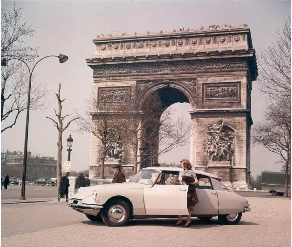
ANNEXE 5 : Document publicitaire présentant la DS 19 devant l'Arc de Triomphe (1957).